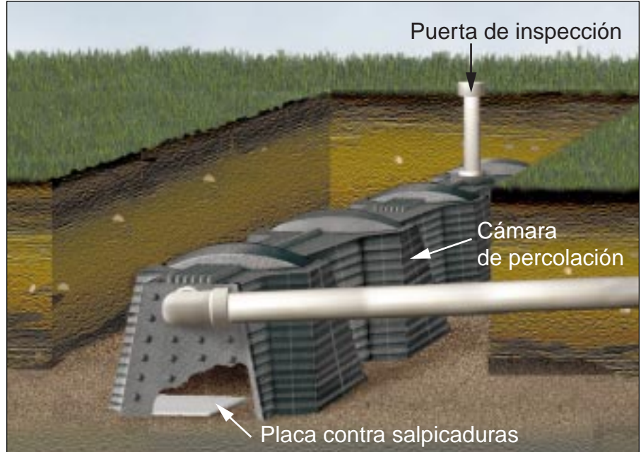
Figura 2: Las zanjas de la cámara de percolación no pueden ser más largas de 150 pies.

Las cámaras de percolación son un producto de marca registrada, así que, por favor, siga las recomendaciones del fabricante para hacer el mantenimiento del sistema. Otras indicaciones son: